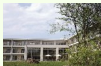
【有料老人ホーム せせらぎ】