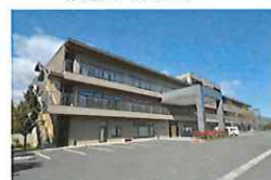
介護老人保健施設 わかな